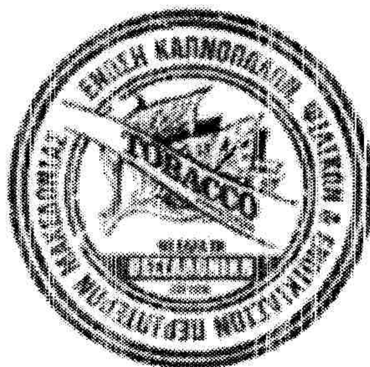
LOGO - ΣΩΜΑΤΕΙΟΥ ΚΑΠΝΟΠΩΛΩΝ & ΠΕΡΙΠΤΕΡΩΝ ΜΑΚΕΔΟΝΙΑΣ.jpg 402K